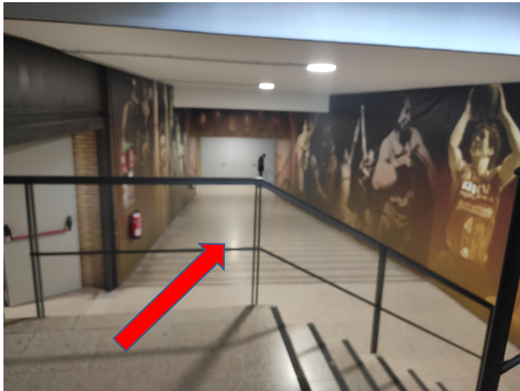
Accés pistes laterals